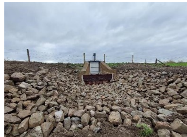
Bodembescherming geplaatst bij het sluisje t.p.v. de Spaanse Schans