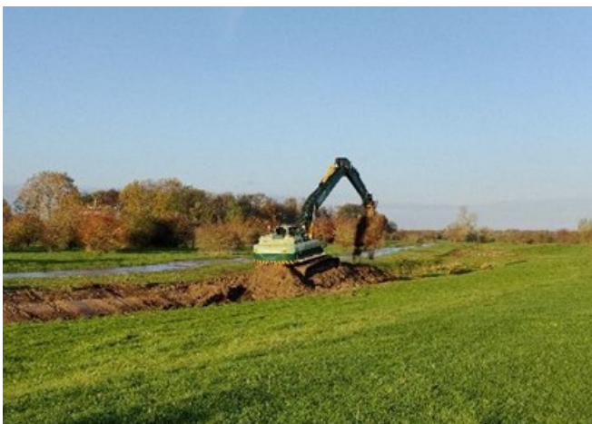
Hydraulische kraan is bezig met het ontgraven van smalle geulen in de noordzijde van het projectgebied.