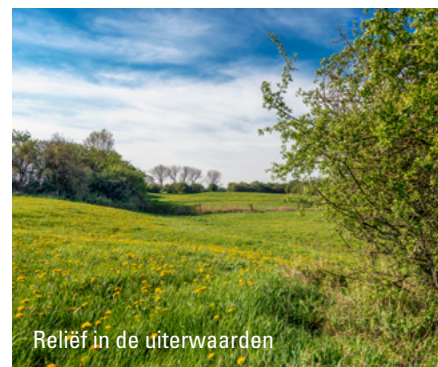
Reliëf in de uiterwaarden

glanzend fonteinkruid. Daarnaast vind je in Cortenoever het nog gave reliëf van kronkelwaardgeulen. Dat zijn sikkelvormige laagten in een uiterwaard in de binnenbocht van een sterk gekromde rivier.