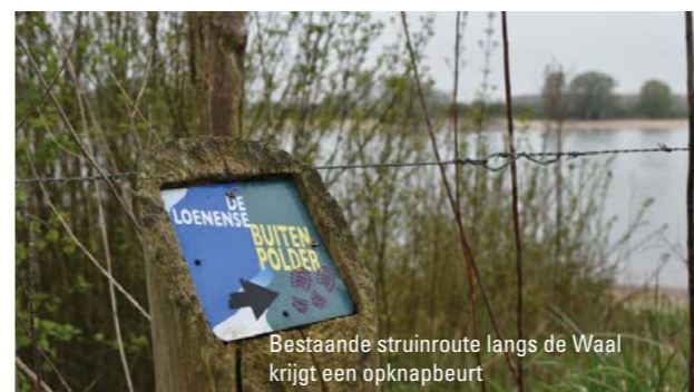
Bestaande struinroute langs de Waal krijgt een opknapbeurt

Let op: uitnodiging informatiebijeenkomst op 19 juni 2017 (zie volgende pagina)!