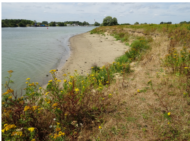
Ontsteende Maasoever bij Keent in de gemeente Oss