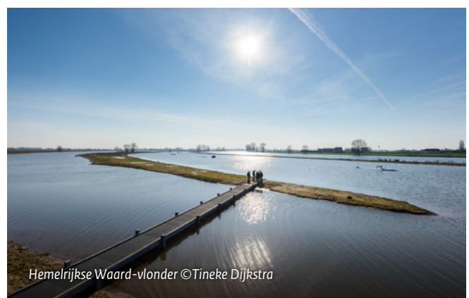
Hemelrijkse Waard-vlonder

Bij het uitvoeren van maatregelen streven we ernaar bewust om te gaan met materieel en grondstoffen. Waar mogelijk werken we energieneutraal en volgens de principes van de circulaire economie. De machinisten werken zoveel mogelijk met energiezuinig materieel en laten hun graafmachines of shovels niet meer stationair draaien. Daarnaast hergebruiken we restmateriaal zoals grind, klei of steen in andere projecten en beperken het transport van dit materiaal.