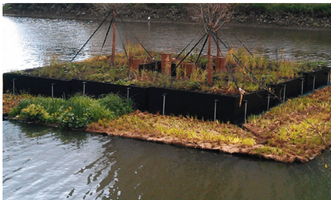
Schanskorf toepassen bij harde oevers