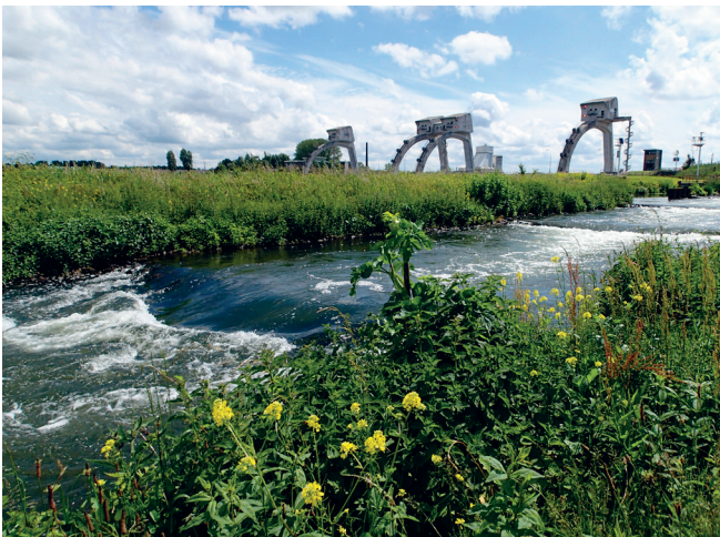
Vistrap stuw Hagestein