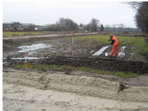
Boringen om bodemkwaliteit te meten