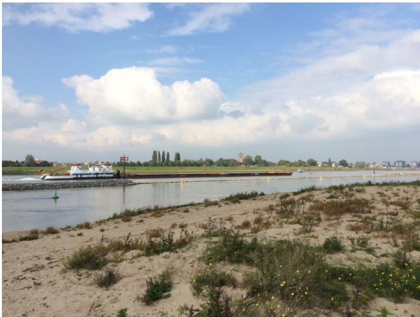
De Waal bij Wamel

Met deze nieuwsbrief informeren wij u over de voortgang van het project.