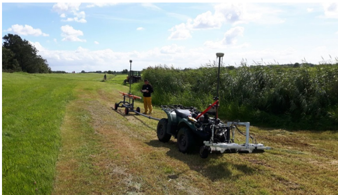
Apparatuur voor uitvoering van een EM-scan

Eén van de eerst geplande onderzoeken is een zogenaamde EM-scan. Dat is een elektromagnetisch onderzoek dat inzicht geeft in de kleidiktes in de bodem. Verder voeren we bodemonderzoek uit met boringen om de kwaliteit van de bodem beter in beeld te brengen. Onderstaande foto's geven een beeld van de apparatuur die wordt ingezet voor de EM-scan (links) en de manier waarop de boringen worden uitgevoerd (rechts).